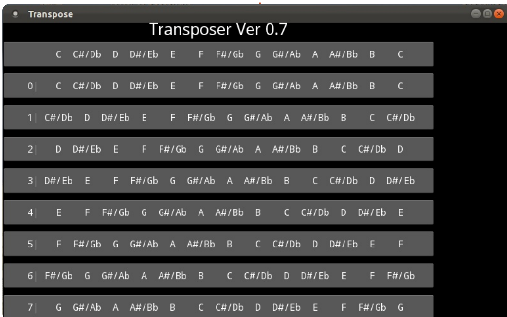
programmer en python